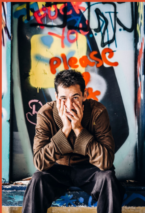
Skad - collectif CH2